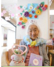
お誕生日会 開催しました